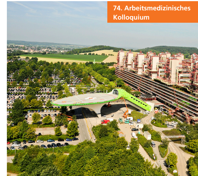
74. Arbeitsmedizinisches Kolloquium