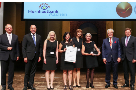
Verleihung des LEP 2018 im Radialsystem V, Berlin, 15.06.2018